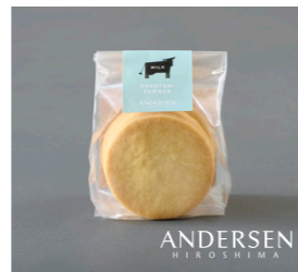
サゴタニ牧農のミルクサブレ