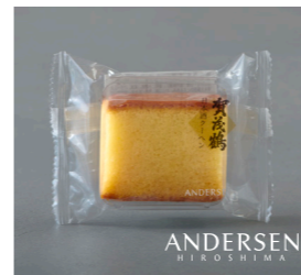
賀茂鶴日本酒クーヘン