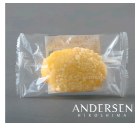
瀬戸田レモンクーヘン