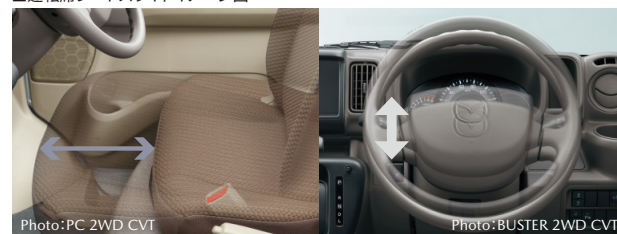
■運転席シートスライドイメージ図

運転席のシートスライド量は230mm※1。ステアリングの高さを調整できるチルトステアリングとあわせて、運転しやすく疲れにくい運転姿勢を保てます。