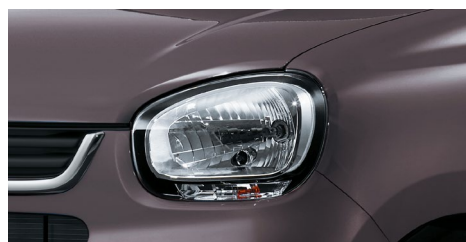
マルチリフレクターハロゲンヘッドランプ