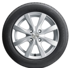
14インチアルミホイール