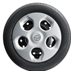
14インチフルホイールキャップ