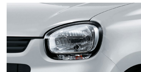
マルチリフレクターハロゲンヘッドランプ

※1 Body Color: フォギーブルーパールメタリック2トーンカラー(ベージュルーフ)