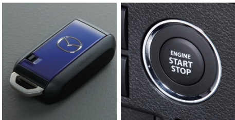
アドバンストキーレスエントリー(アンサーバック機能付)&キーレスプッシュボタンスタートシステム