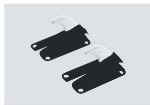
車いす簡易固定装置 Z1S5 V0 520 電動ウインチで車いすを引き上げた際、フック部分を車いす側の固定具(アンカーバー)に引っ掛けることで、しっかりと固定することができます。

※ 車いす簡易固定装置は、固定具(アンカーバー)に対応した車いすのみ固定できます。固定具(アンカーバー)非装備の車いすは固定できませんので、車両に装備された後部固定ベルトをご使用ください。 ※ 車いす簡易固定装置は、一般社団法人日本福祉車輦協会が主催する「車椅子簡易固定標準化コンソーシアム」のガイドラインに準拠しています。