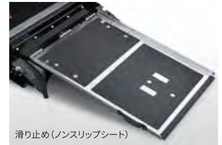
滑り止め(ノンスリップシート)

スロープの表面には滑り止め加工が施してあり、雨の日などの乗せ降ろしをサポートします。