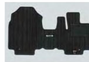
フロアマット Z1S5 V0 320 消臭機能付。フロント+リアセット。 フロントはメタルオーナメント付。