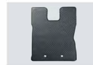
車いす乗車スペースフロアマット Z1S5 V0 350