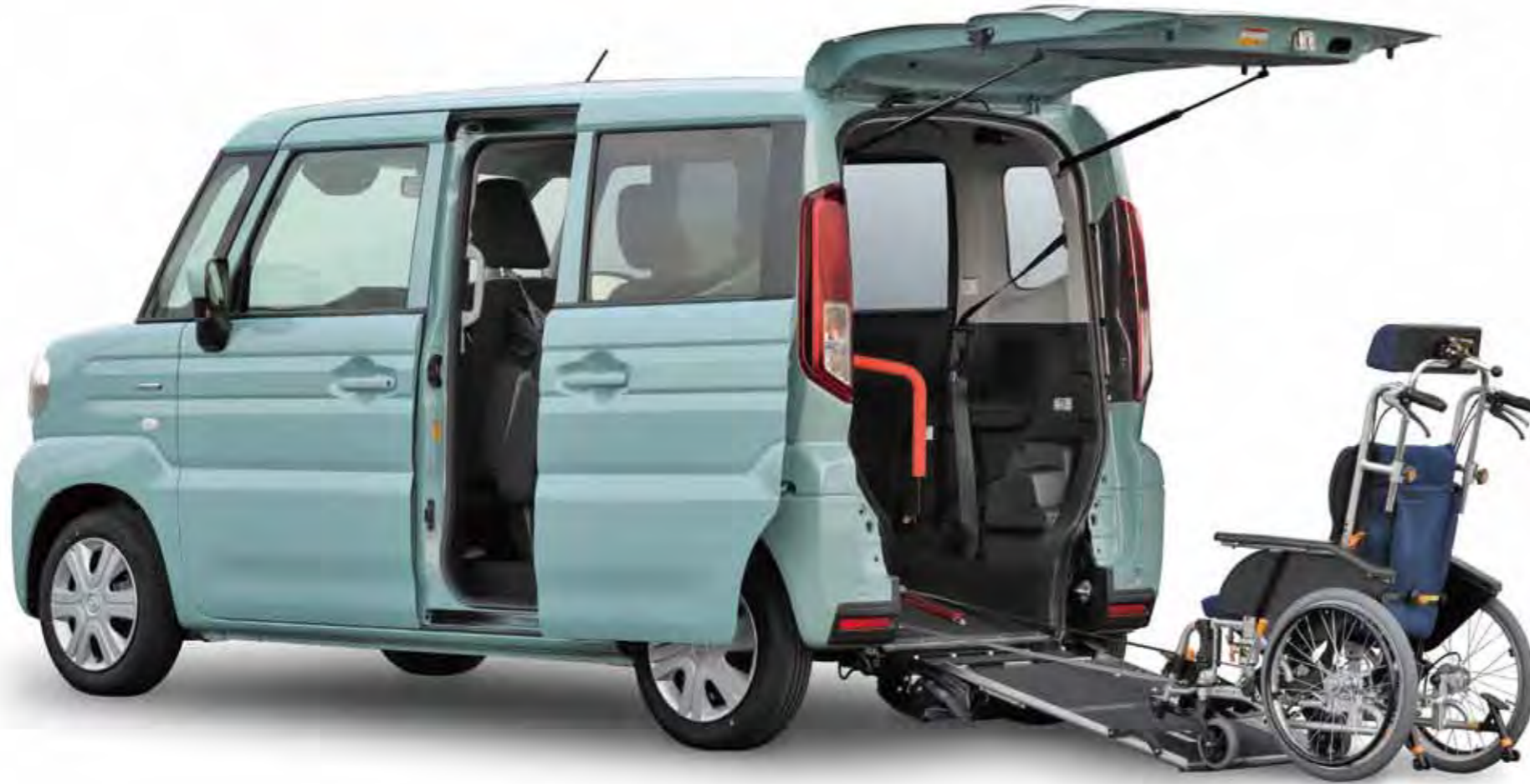
Photo: [表紙含む全ページ]XGリアシート付車(3/4人乗り) Body Color: オフブルーメタリック 車いすは標準装備に含まれません。