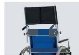
車いす取付用ヘッドレスト Z0C2 V9 490B