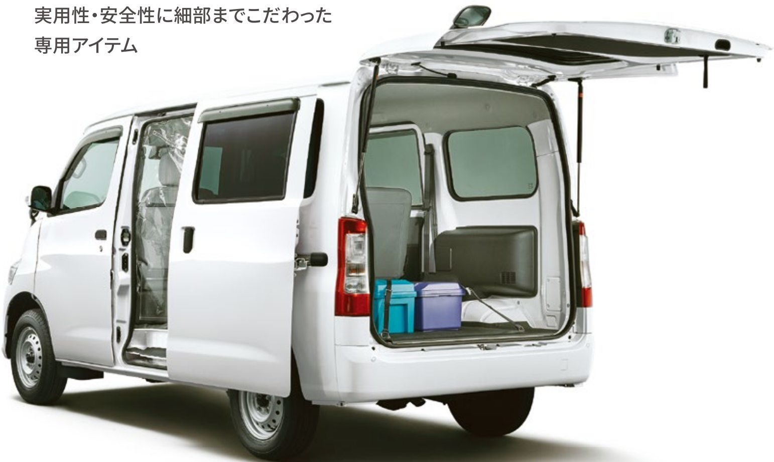
※写真はイメージです。写真に掲載の固定ベルト・荷室フックはマツダ純正品としての設定はありません。写真撮影用の小道具は商品に含まれません。