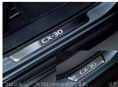
フロント ※フロントのみ点灯します。 リア