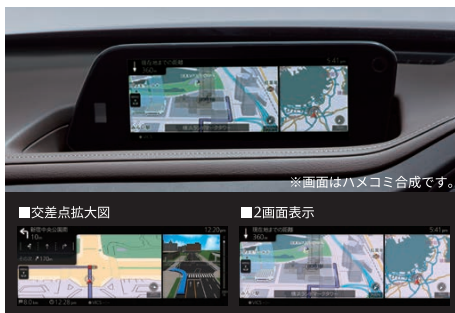
※画面はハメコミ合成です。