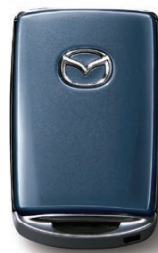
POLYMETAL GRAY METALLIC