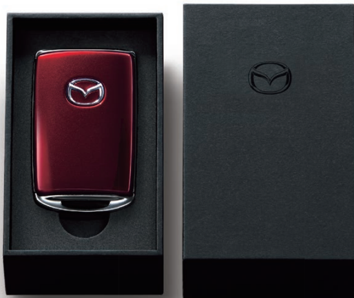
SOULRED CRYSTAL METALLIC

美しさに魅せられる。離れていても愛車を感じる。 手にするたびに深まる愛車との絆。