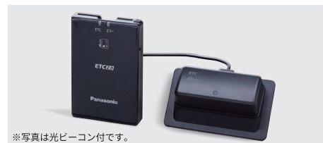
※写真は光ビーコン付です。