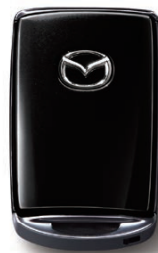
JET BLACK MICA