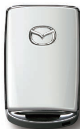
SNOW FLAKE WHITE PEARL MICA