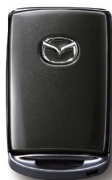
MACHINE GRAY PREMIUM METALLIC