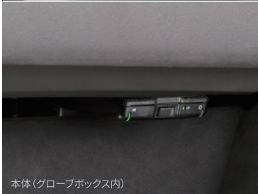
本体(グローブボックス内)