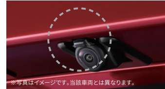
※写真はイメージです。当該車両とは異なります。