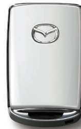
SNOW FLAKE WHITE PEARL MICA