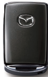
MACHINE GRAY PREMIUM METALLIC