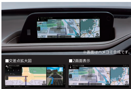
※画面はハモコみ合成です。