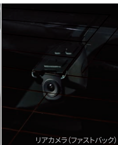
リアカメラ(ファストバック)