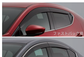
ファストバック用