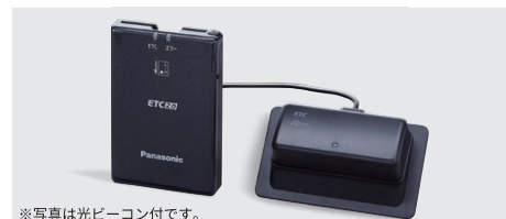
※写真は光ビーコン付です。