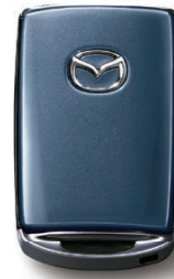
POLYMETAL GRAY METALLIC