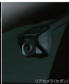
リアカメラ(セダン)