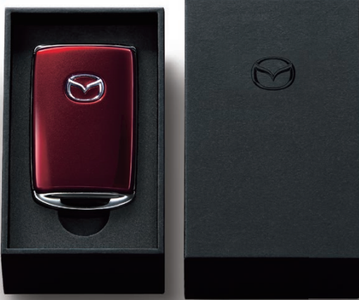
SOULRED CRYSTAL METALLIC

美しさに魅せられる。離れていても愛車を感じる。 手にするたびに深まる愛車との絆。