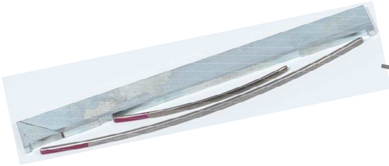
アペックスシール&スプリング Apex Seal & Spring