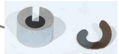
コーナーシール&スプリング Corner Seal & Spring