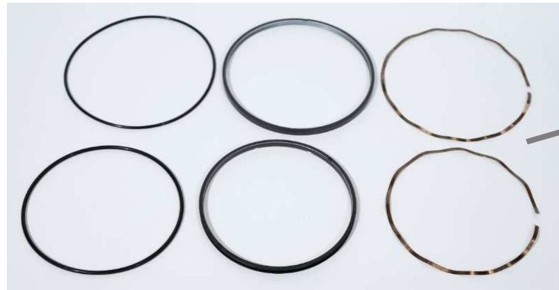
オイルシール、リング&スプリング Oil Seal ,O Ring & Spring