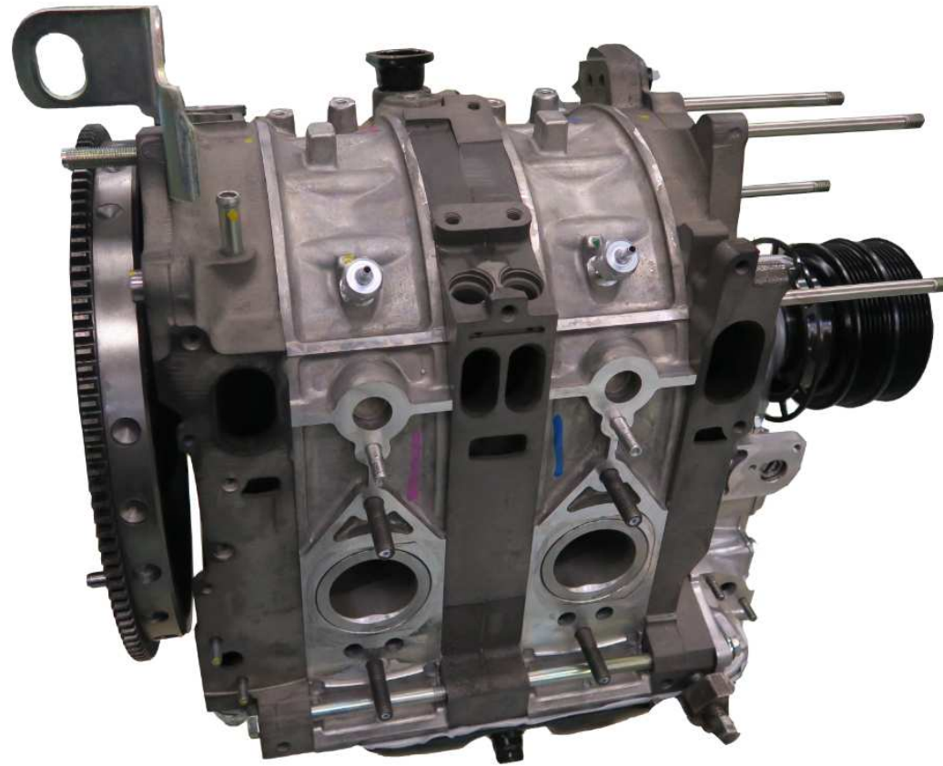
ショートエンジン Short Engine N3G1 02 200 ¥860,981