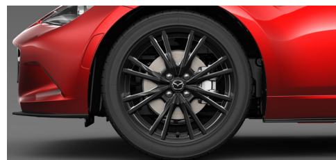
205/45R17 84Wタイヤ&17×7インチアルミホイール ブラックメタリック塗装