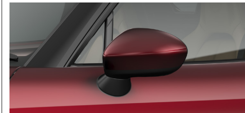
サイドミラー(ボディ同色)