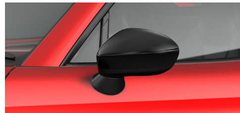
サイドミラー(ピアノブラック)