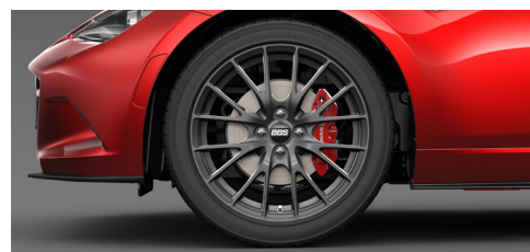
205/45R17 84Wタイヤ&17×7インチ BBS社製鍛造アルミホイール ブラックメタリック塗装 *メーカーセットオプション