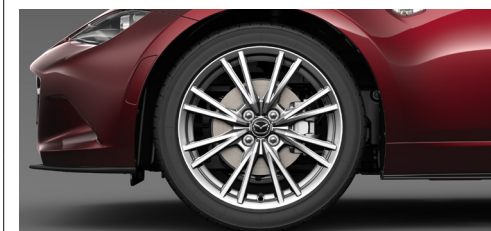
205/45R17 84Wタイヤ&17×7インチアルミホイール 高輝度塗装

●—●は同一装備を表しています。各グレードの装備については、Technical Informationをご確認ください。