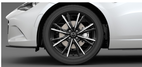
205/45R17 84Wタイヤ&17×7インチアルミホイール 切削加工:ブラックメタリック塗装