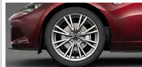
205/45R17 84Wタイヤ&17×7インチアルミホイール 高輝度塗装

●—●は同一装備を表しています。各グレードの装備については、Technical Informationをご確認ください。