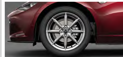
195/50R16 84Vタイヤ&16×6½インチアルミホイール 高輝度塗装

●—●は同一装備を表しています。各グレードの装備については、Technical Informationをご確認ください。