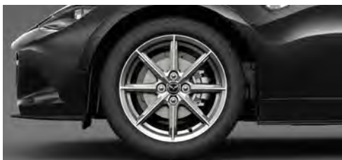
195/50R16 84Vタイヤ&16×6½インチアルミホイール 高輝度塗装