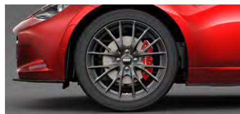
205/45R17 84Wタイヤ&17×7インチ BBS社製鍛造アルミホイール ブラックメタリック塗装 *メーカーセットオプション