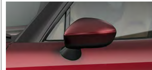
サイドミラー (ボディ同色)