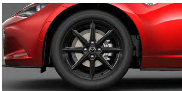
195/50R16 84Vタイヤ&16×6½インチアルミホイール ブラックメタリック塗装

●—●は同一装備を表しています。各グレードの装備については、Technical Informationをご確認ください。