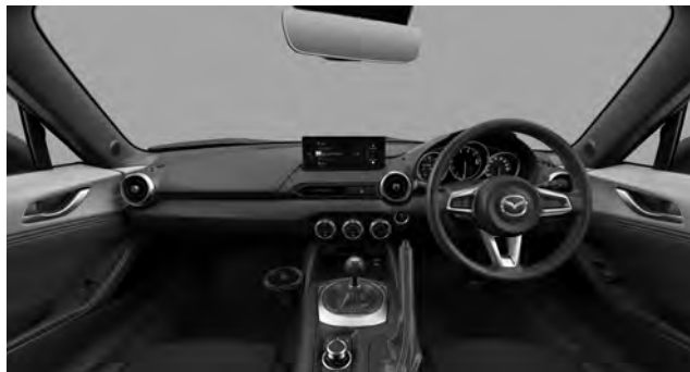
S Special Package

自動防眩ルームミラー(フレームレス)/ インパネ・センターコンソール:樹脂(ブラック)/ 8.8インチセンターディスプレイ/ エアコンルーバー加飾 外側/内側(サテンクロームメッキ/ブラック)