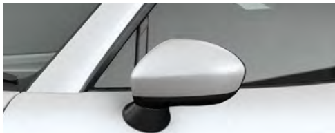
サイドミラー (ボディ同色)