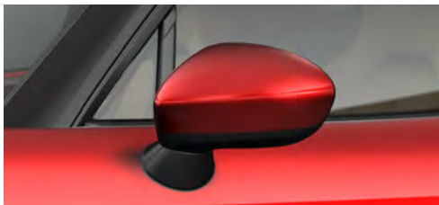
サイドミラー(ボディ同色)