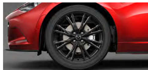
205/45R17 84Wタイヤ&17×7インチアルミホイール ブラックメタリック塗装