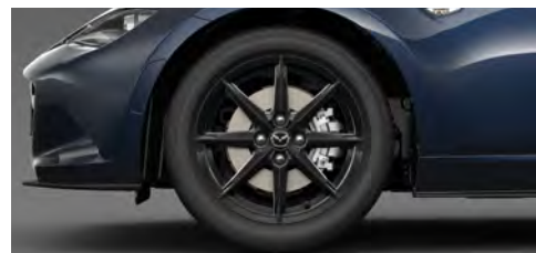
195/50R16 84Vタイヤ&16×6½インチアルミホイール ブラックメタリック塗装