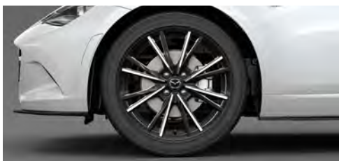
205/45R17 84Wタイヤ&17×7インチアルミホイール 切削加工:ブラックメタリック塗装