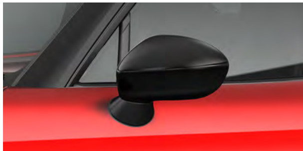
サイドミラー(ピアノブラック)