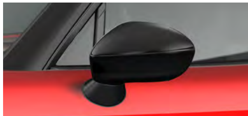
サイドミラー(ピアノブラック)