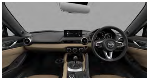
S Leather Package V Selection

自動防眩ルームミラー(フレームレス) / インパネ・センターコンソール:合成皮革(スポーツタン) / 8.8インチセンターディスプレイ / エアコンルーバー加飾 外側/内側(サテンクロームメッキ/ブラック)