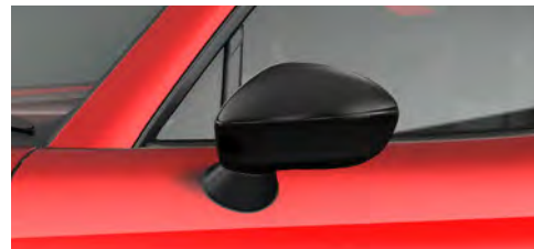
サイドミラー (ピアノブラック)