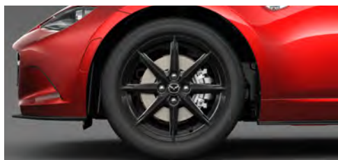
195/50R16 84Vタイヤ&16×6½インチアルミホイール ブラックメタリック塗装