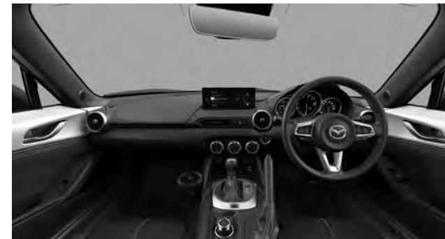
S Leather Package

自動防眩ルームミラー(フレームレス)/ インパネ・センターコンソール:合成皮革(ブラック)/ 8.8インチセンターディスプレイ/ エアコンルーバー加飾 外側/内側(サテンクロームメッキ/ブラック)