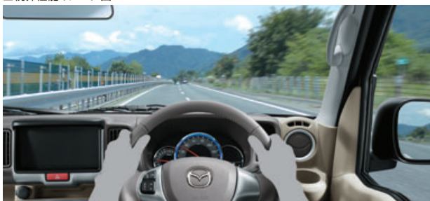
■視界性能イメージ図

右左折時の横断歩行者や交通状況を把握しやすいピラーやドアミラー位置、ピラー断面とピラートリム形状の最適化などにより、視認性を向上させています。