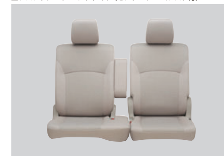
■フロントシートベンチタイプ(センターアームレスト付)

運転席と助手席は独立しているが座面がベンチシートなので、助手席からの乗り降りもスムーズにできます。