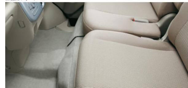
■前席ウォークスルー

シフトをインパネに配置することで前席の足元に広いスペースを確保。前席での移動もスムーズです。