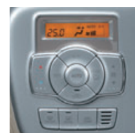
■フルオートエアコン、リアヒーターイメージ図