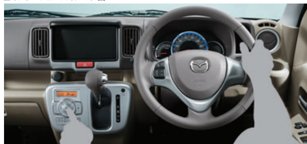
■インターフェースイメージ図

視認性の高いメーターやディスプレイと、視認性や手の届きやすさ(押す、つまむ、握る)・操作方法・操作頻度などを考慮したスイッチ類の配置は、安心して運転に集中できる環境を提供します。