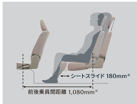
■リアシートスライド機構イメージ図

左右独立スライド機構付のリアシートは、前後に180mm*スライド。リクライニング機構とあわせ、リアシートに座る人ものびのび過ごせます。