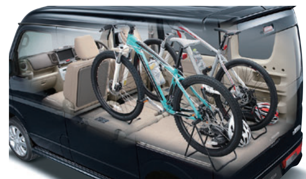
■ 2名乗車+荷物 *自転車のサイズ・形状によっては積載できない場合があります。