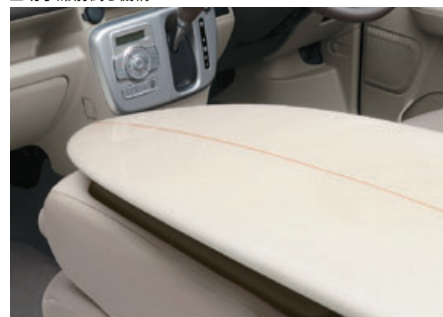
■助手席前倒し機構