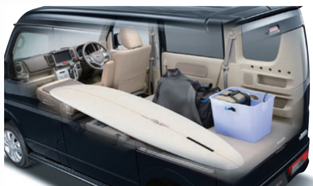
■ 1名乗車+荷物 *サーフボードのサイズ・形状によっては積載できない場合があります。